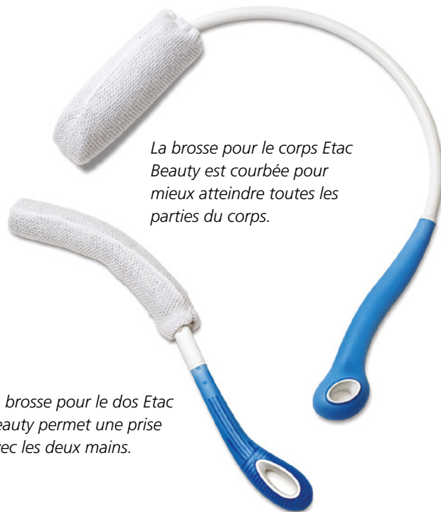
La brosse pour le corps Etac Beauty est courbée pour mieux atteindre toutes les parties du corps.